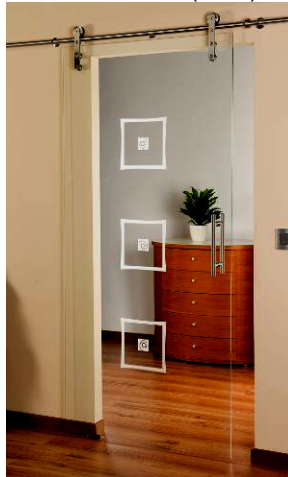
3206 „Merano“ (P+N)