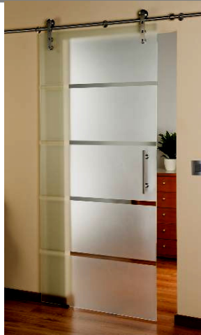
3056-10 „Slim“ (P+N)