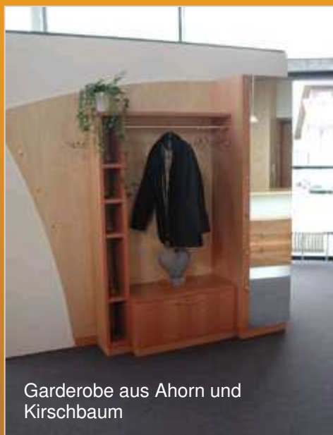
Garderobe aus Ahorn und Kirschbaum