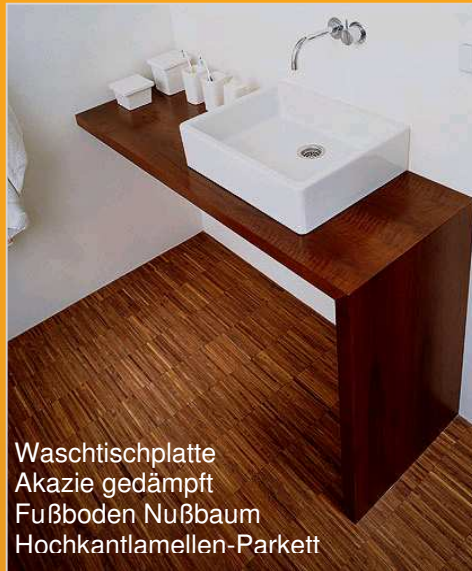
Waschtischplatte Akazie gedämpft Fußboden Nußbaum Hochkantlamellen-Parkett

Den Umfang der Bearbeitung, die wir für Sie vornehmen, bestimmen Sie selbst. Wir schneiden, fräsen und bohren nach Ihren Wünschen, möchten aber darauf hinweisen, daß wir keine Schreinerei sind und lediglich Halfertigteile liefern.