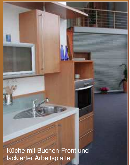
Küche mit Buchen-Front und lackierter Arbeitsplatte