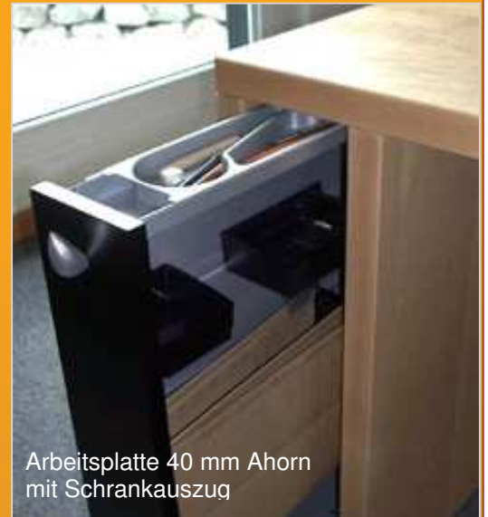
Arbeitsplatte 40 mm Ahorn mit Schrankauszug