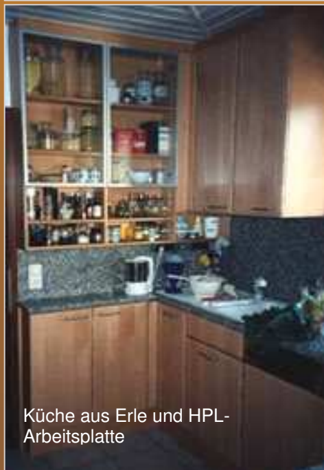
Küche aus Erle und HPL- Arbeitsplatte