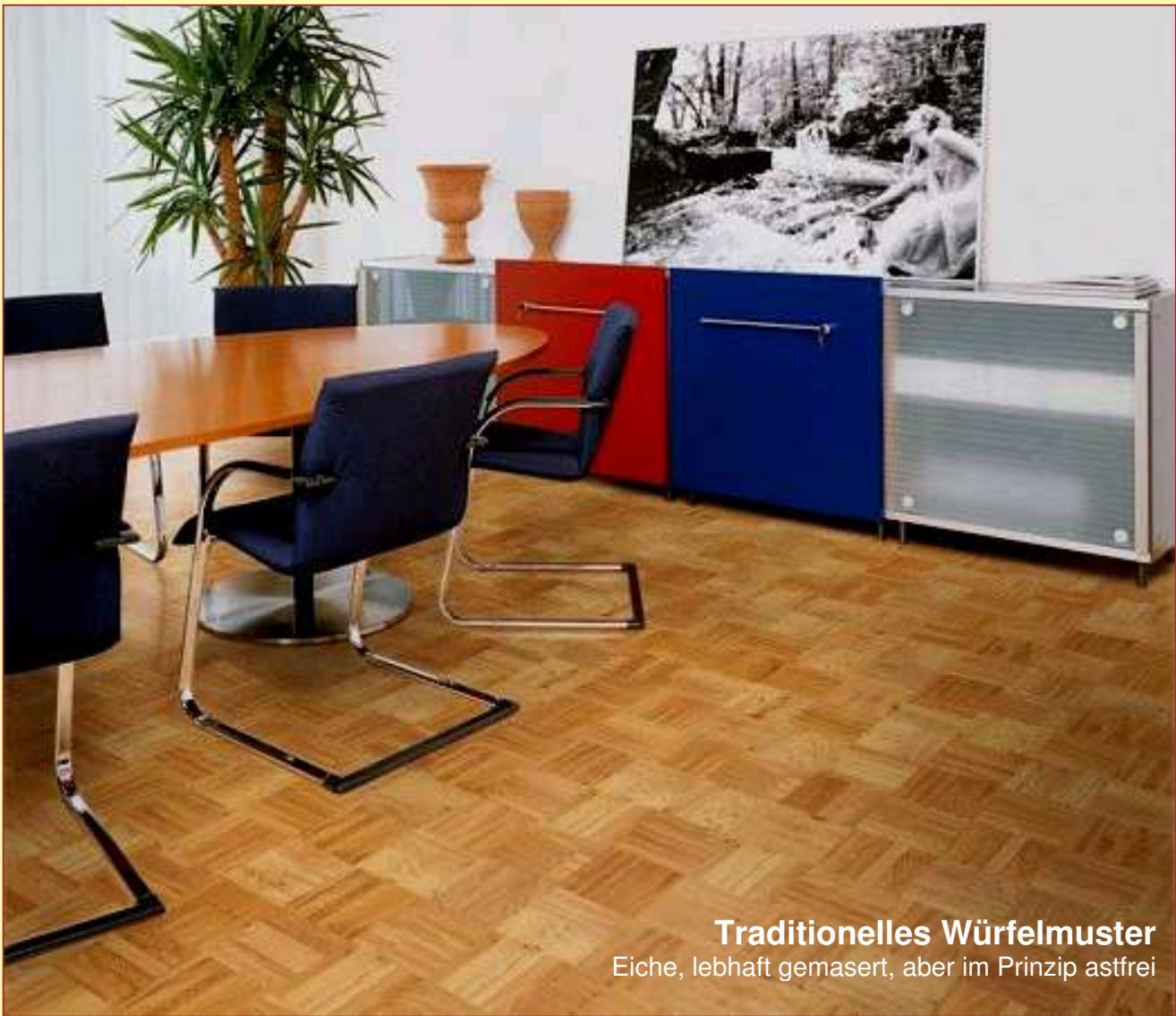
Traditionelles Würfelmuster Eiche, lebhaft gemasert, aber im Prinzip astfrei