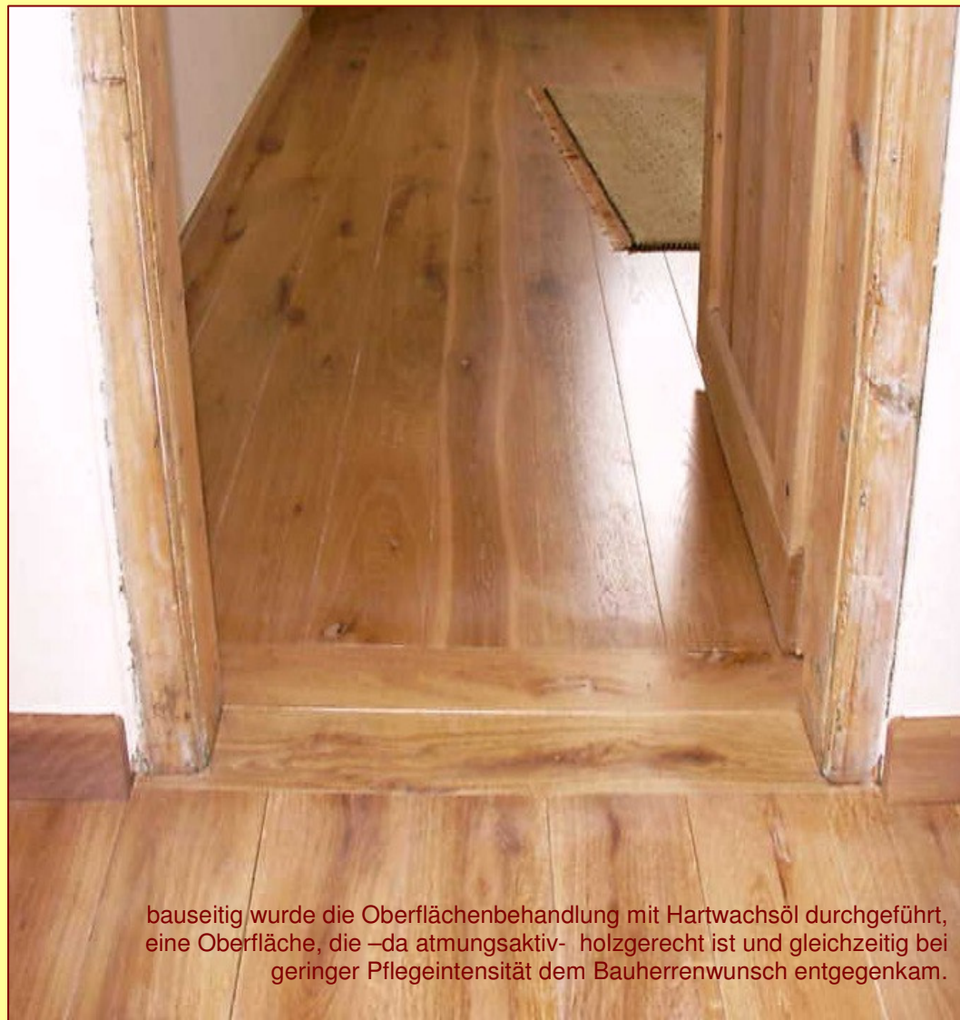
bauseitig wurde die Oberflächenbehandlung mit Hartwachsöl durchgeführt, eine Oberfläche, die –da atmungsaktiv- holzgerecht ist und gleichzeitig bei geringer Pflegeintensität dem Bauherrenwunsch entgegenkam.