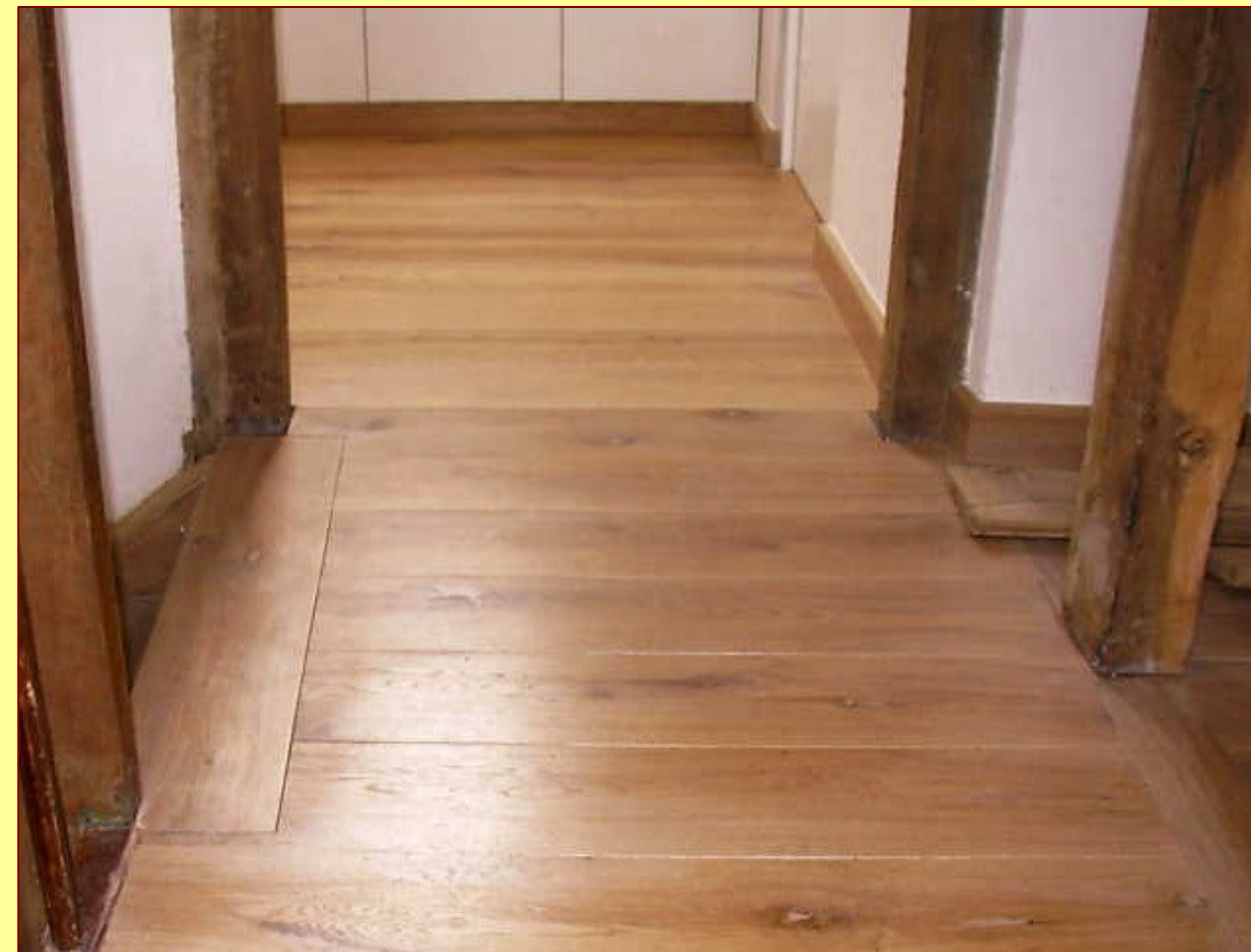
Deutlich zu sehen: die handwerklich eingebaute „Schwelle“ am Treppenabgang. Solche Schwellen können auch bei einem Wechsel der Verlegerichtung, zum Beispiel in Türdurchgängen eingebaut werden und ergeben einen sauberen Abschluß

Aus einem alten Gehöft im Westerwald sollte ein den heutigen Ansprüchen genügendes Wohnhaus gestaltet werden, ohne auf das traditionelle Ambiente zu verzichten. Letztendlich fiel die Wahl auf Massivdielen aus europäischer Eiche, die raumlang, d.h. von Wand zu Wand verlegt wurden. Dabei wurde bewußt auf traditionelle Verarbeitung Wert gelegt, so hat der Verleger beispielsweise beim Treppenabschluß die letzte Stufe in den Belag eingearbeitet. In gleicher Weise wurde im Bereich der Türdurchgänge verfahren, indem quer zur allgemeinen Verlegerichtung „Schwellen“ ausgebildet wurden, auch dies in Anlehnung an die handwerklichen Methoden vergangener Jahrhunderte, in denen die Schwelle als Türdichtung fungierte. Auffällig: Äste und Verwachsungen machen den individuellen Reiz dieses Fußbodens aus. Vom Verleger wurden Astausbrüche und Risse beigespachtelt in einem Farbton, der auf Dauer den Dielen entsprechen wird. Puristen verwenden hierzu schwarzen Spachtel, der die rustikale Anmutung noch stärker betont. Ein Jahrhundertboden für ein Projekt bis ins nächste Jahrhundert.