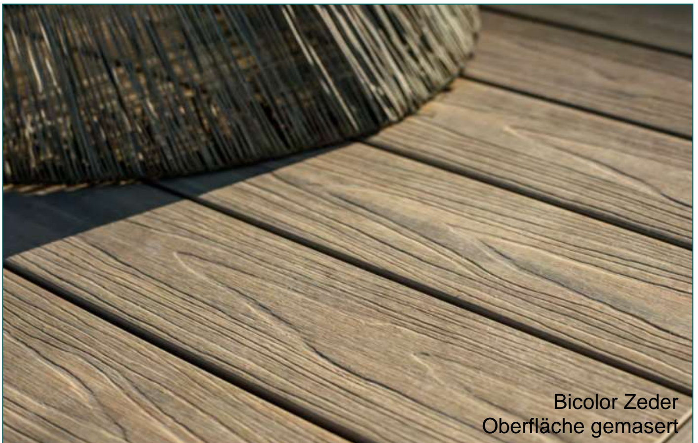
Bicolor Zeder Oberfläche gemasert