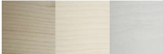
001 farblos 200 edelweiss 650 weiss