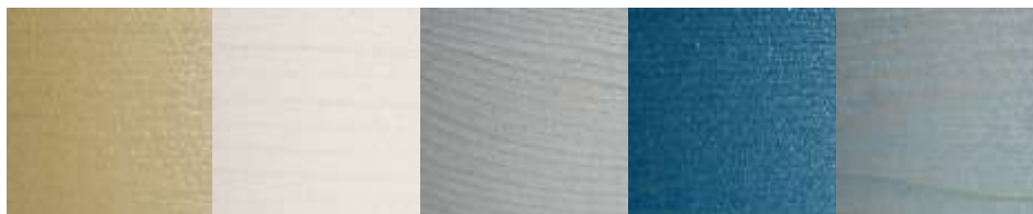
025 mais 027 weiss 028 silbergrau 029 azurblau 031 blau