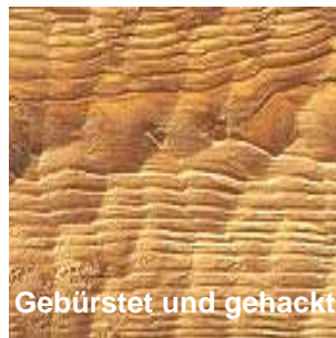
Gebürstet und gehackt